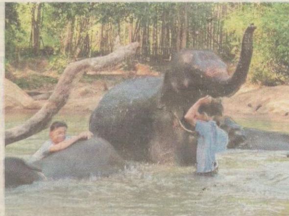
Orang ramai berkesempatan melihat gajah secara dekat di Kenyir Elephant Conservation Village