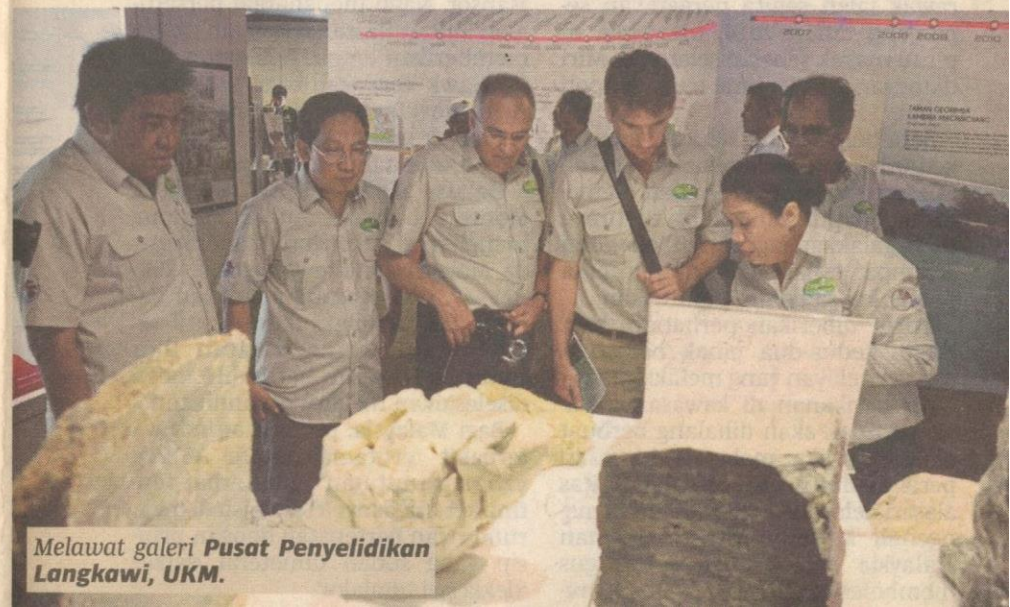
Melawat galeri Pusat Penyelidikan Langkawi, UKM.