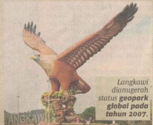
Langkawi dianugerah status geopark global pada tahun 2007.