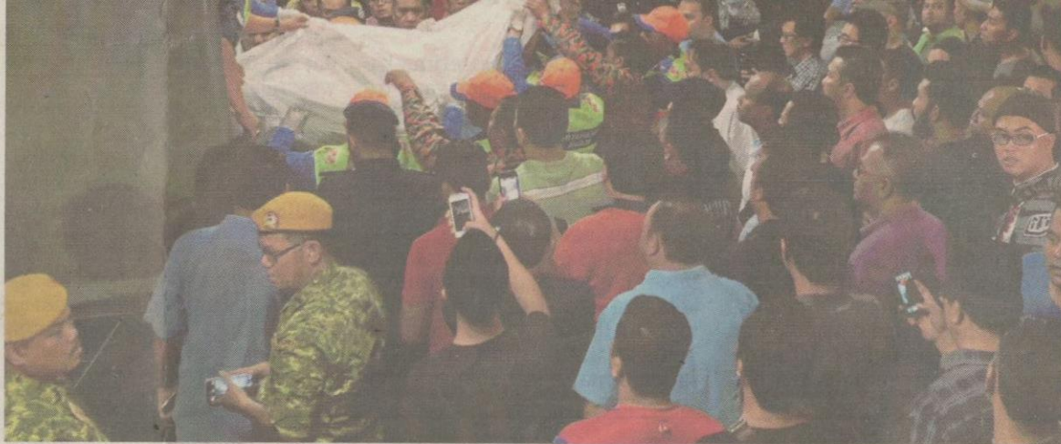
Anggota bomba dan JPAM menurunkan jenazah mangsa sejurus tiba di HKL untuk dibedah siasat.

Sementara itu, di pekarangan Unit Forensik Hospital Kuala Lumpur (HKL), di sini, diselubungi suasana pilu apabila rakan mangsa nahas helikopter terhempas di Kampung Pasir Baru, Sungai Pe-