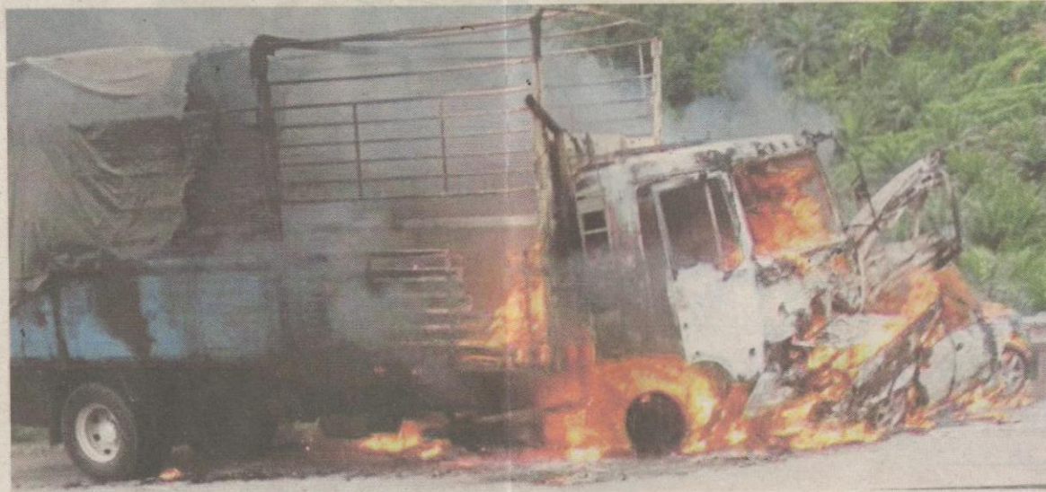
Kenderaan mangsa di lorong kecemasan sebelum hangus dilanggar lori yang hilang kawalan (gambar kanan) di LPT2, petang semalam.

Hulu Terengganu: "Saya sempat menjerit supaya mereka menyelamatkan diri sebelum melompat melepasi penghadang lebuh raya bagi menyelamatkan diri sebelum lori terbabit merempuh kereta mangsa dan menyeretnya sejauh kira-kira 70 meter.