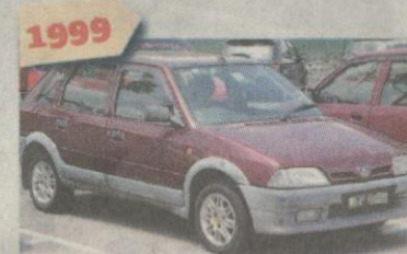
1999 PROTON Tiara