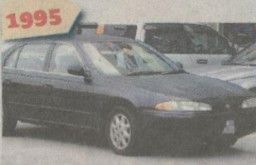
1995 PROTON Perdana