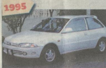
1995 PROTON Satria