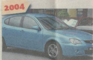
2004 PROTON GEN2