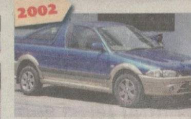
2002 PROTON Arena