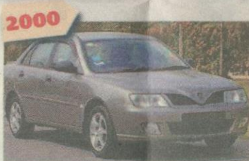
2000 PROTON Waja