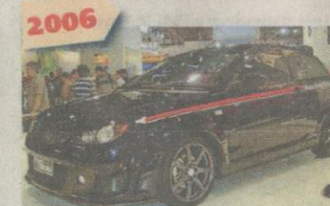
2006 PROTON Satria Neo