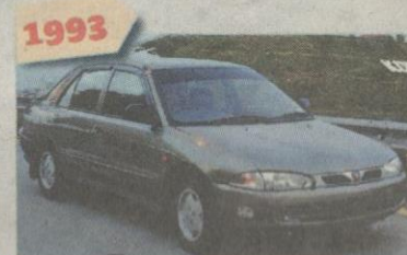
1993 PROTON Wira