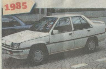
1985 PROTON Saga 1.5l

Pada 1986, PROTON meraikan kejayaan mengeluarkan 10,000 kereta berjaya dijual dalam tem-