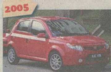
2005 PROTON Savvy