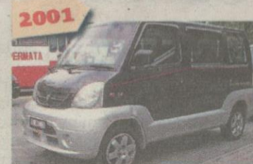
2001 PROTON Juara