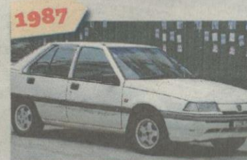
1987 PROTON Saga Iswara