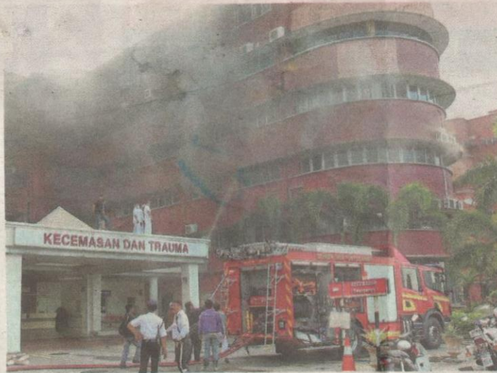
ANGGOTA bomba memadam api yang memusnahkan wad ICU Hospital Sultanah Aminah di Johor Bahru semalam.

Kebakaran yang memusnahkan wad ICU di hospital berusia 134 tahun itu amat mencekam apabila ratusan pesakit, jururawat, doktor, petugas pentadbiran dan tukang cuci berpusu-pusu menuruni tangga meninggalkan bangunan tersebut.