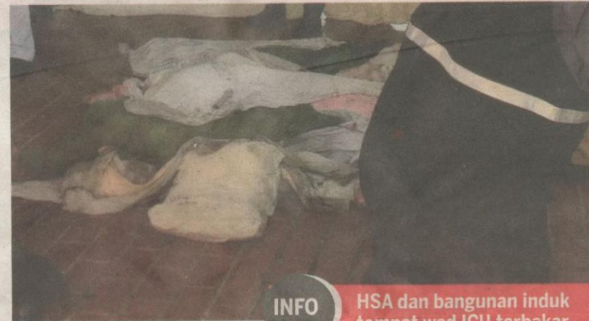
SEBAHAGIAN daripada enam mayat mangsa yang mati terbakar di wad ICU Hospital Sultanah Aminah di Johor Bahru semalam.

Katanya, sebaik berlaku kebakaran, kakitangan hospital bertungkus-lumus mengosongkan wad di hospital itu dan mereka dikumpulkan di kawasan lapang.