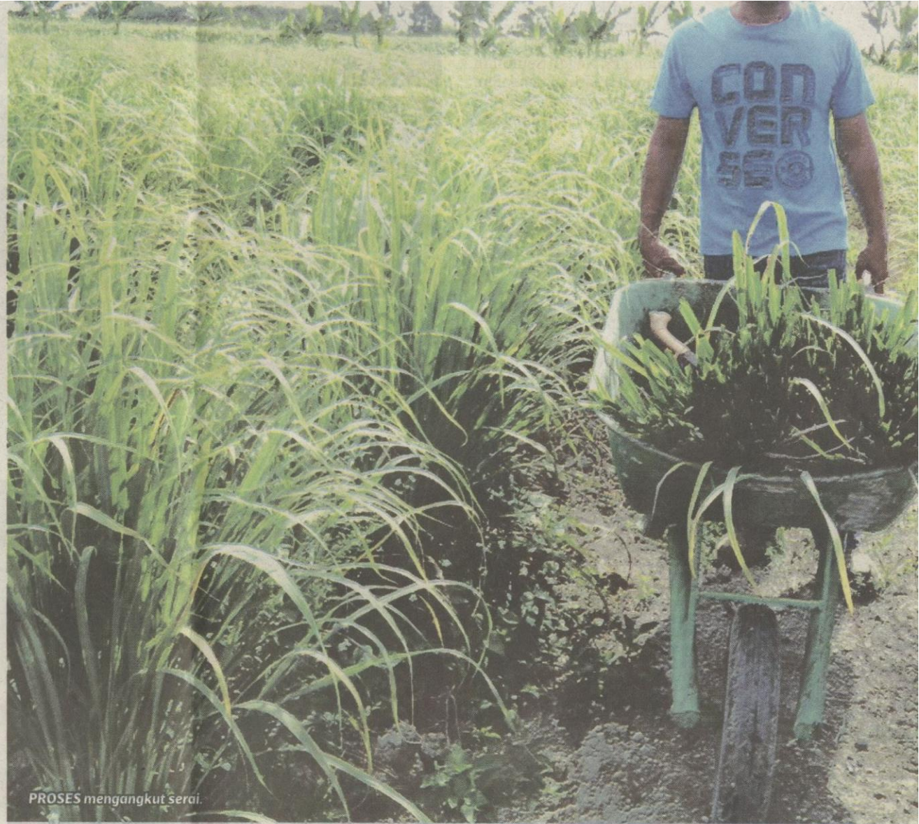
PROSES mengangkut Serai.

Menurut bapa kepada seorang anak itu, keistimewaan serai paha