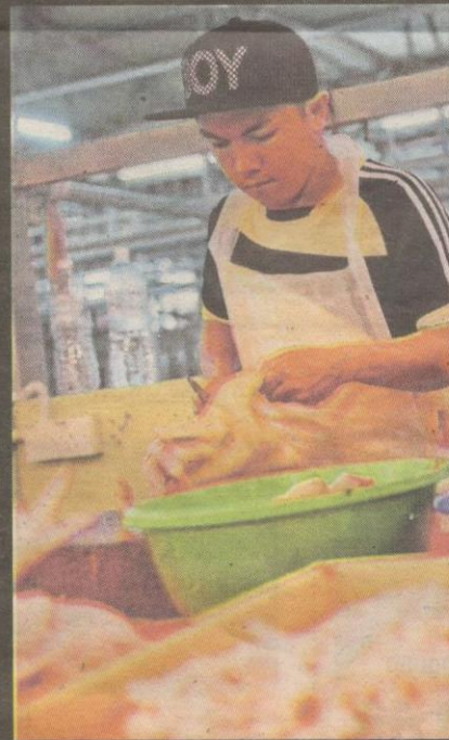
TINJAUAN harga ayam di sekitar pasar Kuala Lumpur.