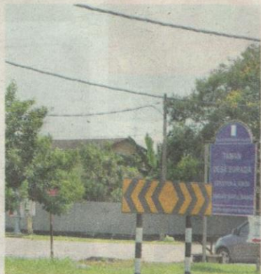
TAMAN Desa Surada, Bandar Baru Bangi tempat salah satu lokasi kejadian samun kelmarin.

suspek merampas beg sandang miliknya, mereka bertindak melarikan diri dengan menaiki dua buah motosikal.