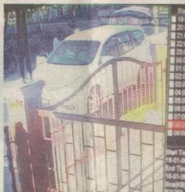
RAKAMAN CCTV menunjukkan sekumpulan lelaki bermotosikal melakukan samun di Bandar Seri Putra, Bangi.