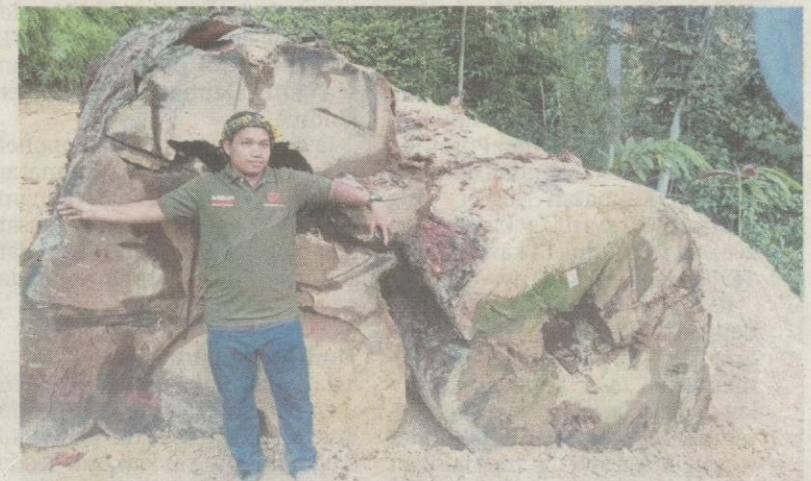
Dendi di kawasan pembalakan haram di sekitar Kampung Berig.

Berikut adalah surat beliau yang dihantar menerusi e-mel kepada Pengarang BH.