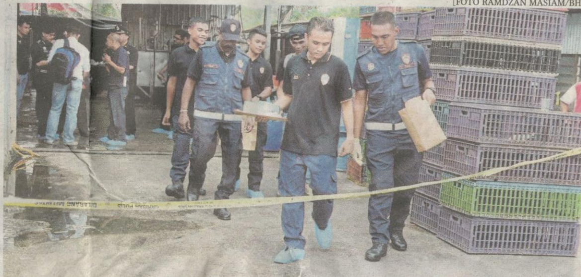
Anggota polis forensik menjalankan siasatan di tempat kejadian kes bunuh empat sekeluarga di kilang memproses ayam di Batu Maung, Bayan Lepas, Pulau Pinang, semalam.