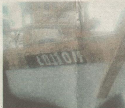
JURAGAN kapal ini diculik sekumpulan enam penjenayah lengkap bersenjata api di perairan Semporna dekat Pulau Gaya kelmarin.