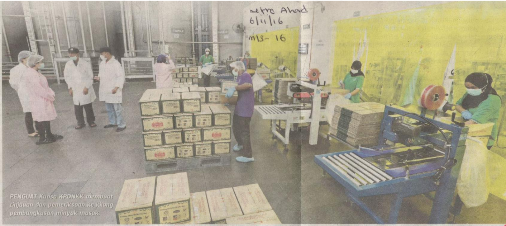
PENGUAT Kuasa KPONKK membuat tinjauan dan pemeriksaan ke kilang pembungkusan minyak masak.

Beliau berkata, hasil pemeriksaan mendapati bekalan minyak masak ada namun pembungkus perlu mengikut kuota yang ditetapkan.