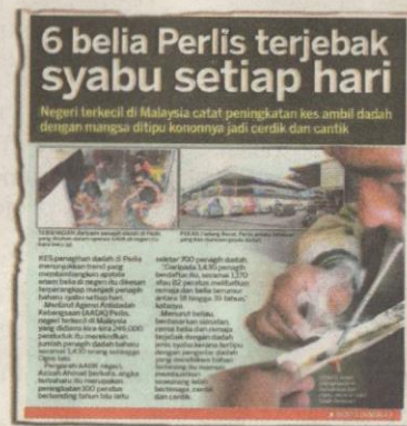
KERATAN Kosmo! semalam.

kan ganja dan ubat tidur untuk membolehkan mereka tidur; manakala heroin diperlukan untuk mendapatkan ketenangan,” ujarnya.