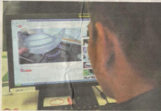
PENGUNA internet boleh mempelajari cara-cara membuat syabu dengan mudah menerusi laman YouTube.

“Sesiapa sahaja boleh menghasilkan syabu kerana kaedah memproses dadah jenis ini boleh dipelajari di internet.