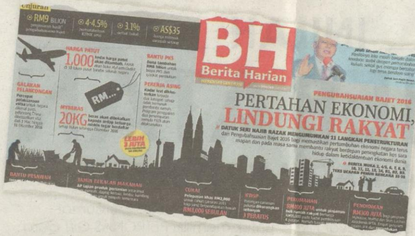
Keratan akhbar BH kelmarin.

Kita panggil semua Kementerian serta agensi dan beritahu, mereka perlu mengoptimalkan perbelanjaan mengurus tanpa menjejaskan penyampaian perkhidmatan. Kita boleh berjimat dalam aspek lain. Contohnya, kita tidak perlu penerbangan kelas pertama dan ini hanya untuk Kementerian Kewangan, bukan semua perkhidmatan awam.