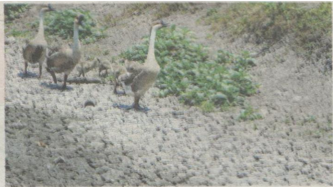
BEBERAPA ekor angsa berkeliaran di kawasan saliran air yang kering kontang di Kuala Nerang, Kedah ekoran musim panas yang melanda negara ini sejak awal tahun.