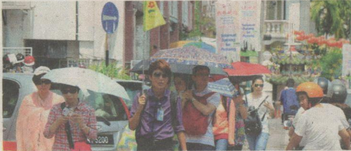
SUHU panas melampau di negara ini dijangka meningkat ekoran fenomena Ekuinoks yang dijangka berlaku selama dua jam hari ini antara pukul 12 tengah hari dan 2 petang. – Gambar hiasan

“Ekuinoks berlaku dua kali setahun iaitu apabila matahari berada tepat di atas garisan