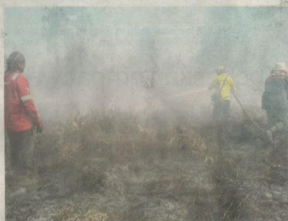
ANGGOTA memadamkan kebakaran hutan di Bekenu, Miri semalam.

deraan dan sisa industri di Lembah Klang,” kata beliau dalam satu kenyataan akhbar di sini semalam.