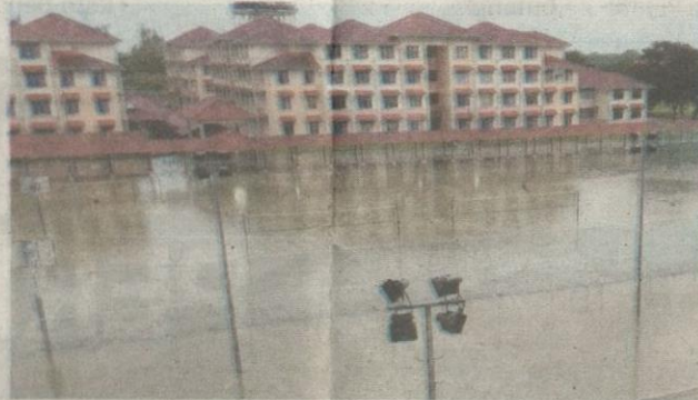
KEADAAN kawasan Politeknik Sultan Idris Shah di Sabak Bernam yang turut terkesan akibat fenomena air pasang besar.