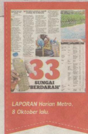
LAPORAN Harian Metro, 8 Oktober lalu.

Empat bahan lain ialah Keperluan Oksigen Kimia (COD) (pembebasan bahan kimia daripada pelepasan industri pembuatan), oksigen terlarut (gas oksigen terlarut dalam air yang tersedia digunakan oleh organisma akuatik), pH (pelepasan ba-