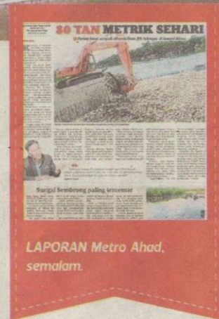
LAPORAN Metro Ahad, semalam.

han berasid atau beralkali yang tinggi dari industri) dan pepejal terampai (bahan dari tapak pembinaan).