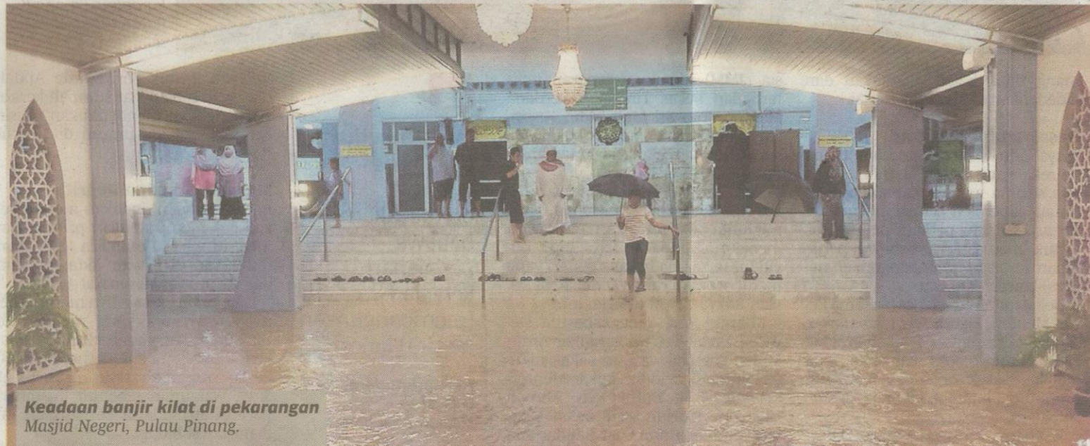
Keadaan banjir kilat di pekarangan Masjid Negeri, Pulau Pinang.