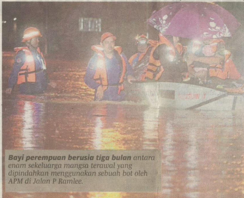
Bayi perempuan berusia tiga bulan antara enam sekeluarga mangsa terawal yang dipindahkan menggunakan sebuah bot oleh APM di Jalan P Ramlee.