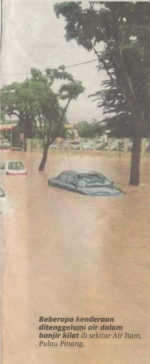
Beberapa kenderaan ditenggelami air dalam banjir kilat di sekitar Air Itam, Pulau Pinang.