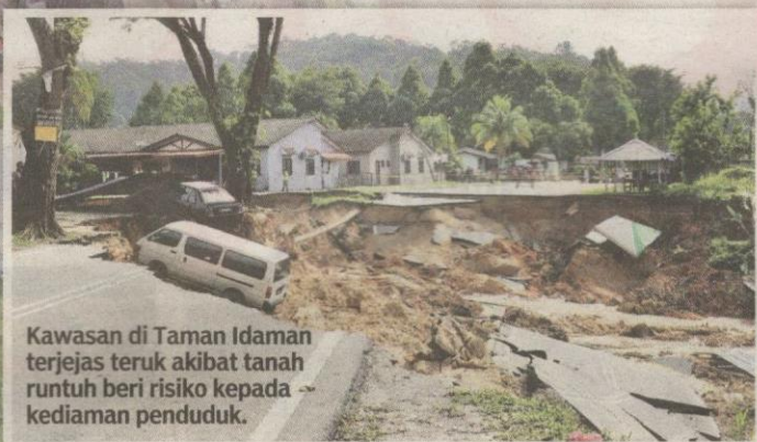
Kawasan di Taman Idaman terjejas teruk akibat tanah runtuh beri risiko kepada kediaman penduduk.

HULU SELANGOR - Pihak polis mengisytiharkan kawasan tanah runtuh di Taman Idaman, Serendah di sini sebagai kawasan larangan Zon Merah.