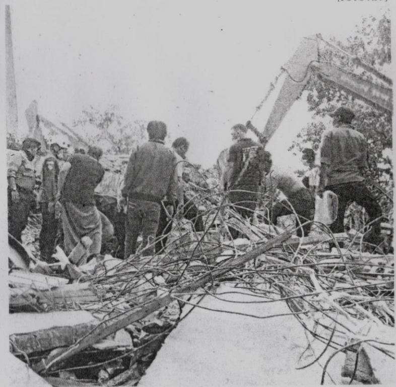
Pasukan penyelamat berusaha mencari dan mengeluarkan mangsa yang tersepit dalam runtuhannya di Pidie, Aceh.