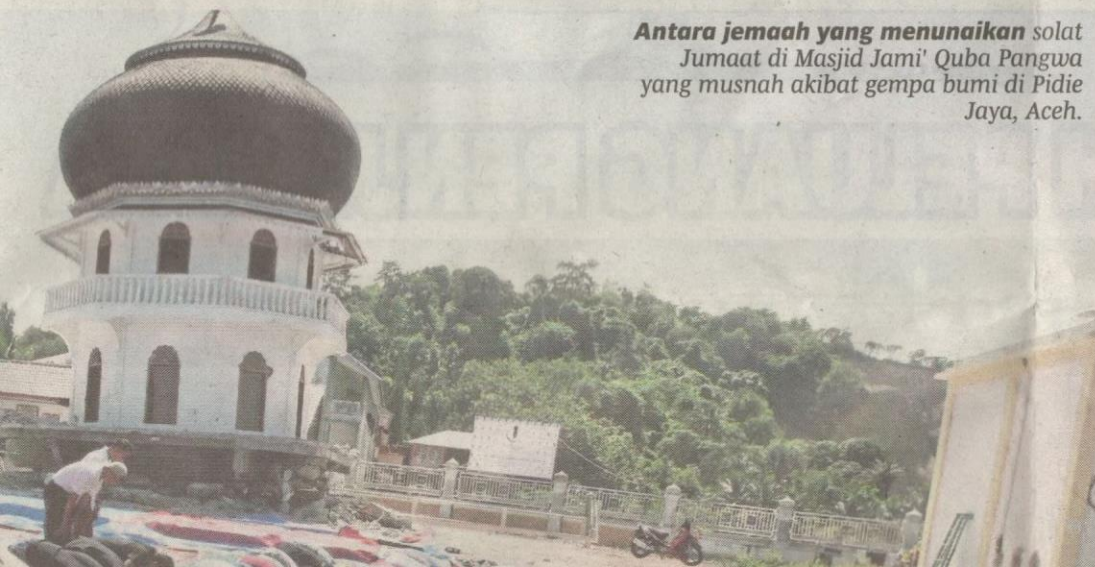
Antara jemaah yang menunaikan solat Jumaat di Masjid Jami' Quba Pangwa yang musnah akibat gempa bumi di Pidie Jaya, Aceh.

Senyuman mula mengukir dan tiada lagi air mata. Itulah perubahan suasana di Kampung Meunasah Lhok, Meureudu, di Pidie Jaya, di sini, apabila sukarelawan Biro Kebajikan UMNO (BKUM) menjejakkan kaki ke kawasan itu petang kelmarin.