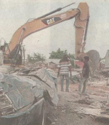
Kerja membersihkan sisa runtuh giat dijalankan di Kampung Trienggadeng, Pidie Jaya.