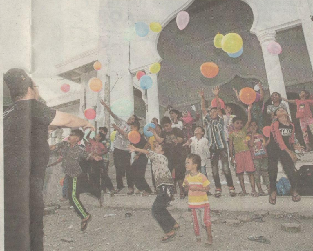
Sukarelawan Biro Kebajikan UMNO melakukan aktiviti bersama kanak-kanak mangsa gempa di Kampung Meunasah Lhok, Meureudu, di Pidie Jaya.

MISI BANTUAN KEMANUSIAAN GEMPA BUMI PD ACEH BIRO KEBAJIKAN UMNO MALAYSIA