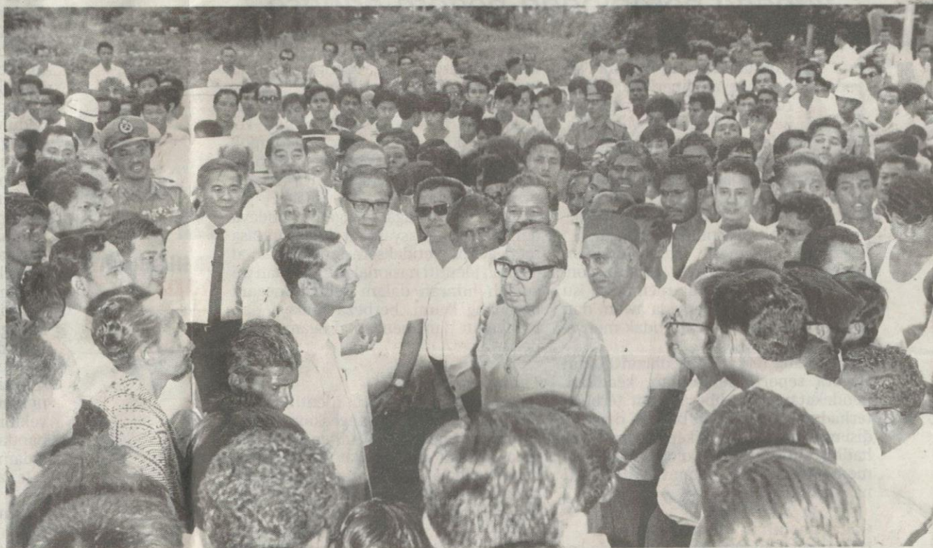
Bertemu orang ramai di Chow Kit antara dasar turun padang diamalkan Tun Razak.

Bagaimanapun, apa yang perlu dan penting ialah menyuntik semangat dan menerapkan integriti kakita-