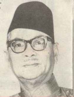
Tunku Abdul Rahman