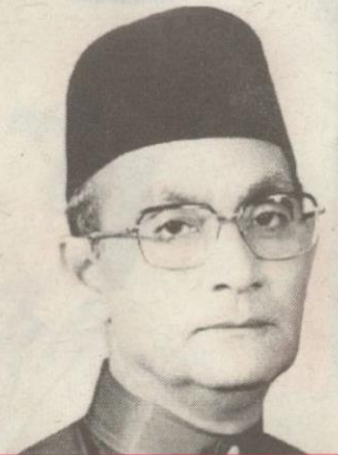
Tun Hussein Onn