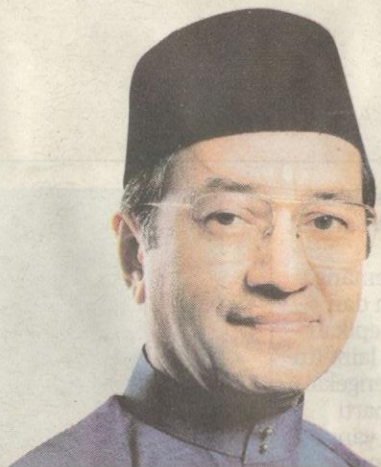
Tun Dr Mahathir Mohamad