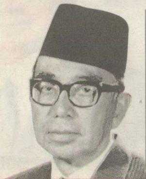
Tun Abdul Razak Hussein