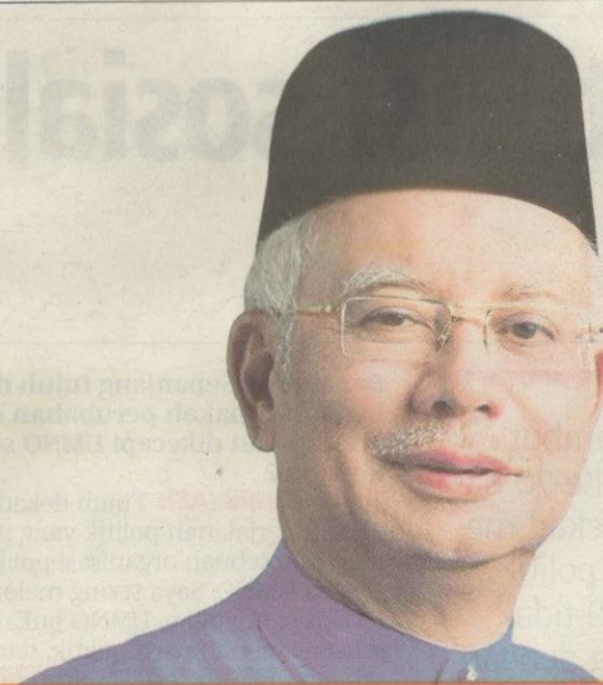
Datuk Seri Najib Razak