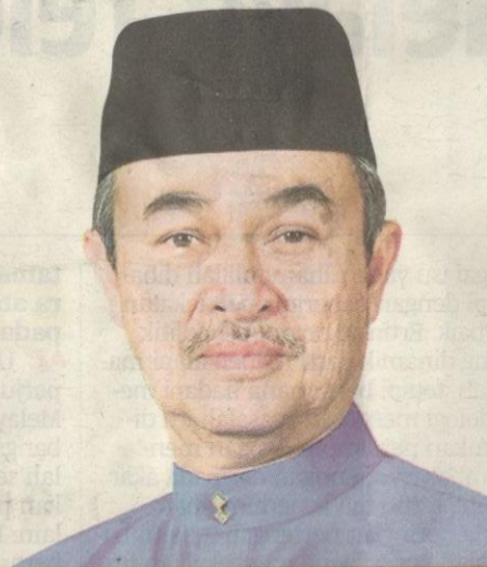
Tun Abdullah Ahmad Badawi