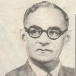
Datuk Onn Jaafar