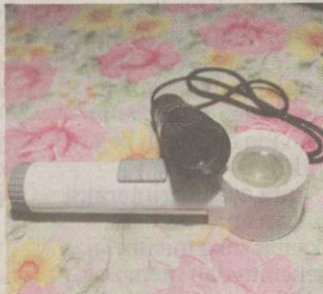
Peralatan yang digunakan Ahmad Azim untuk membaca.