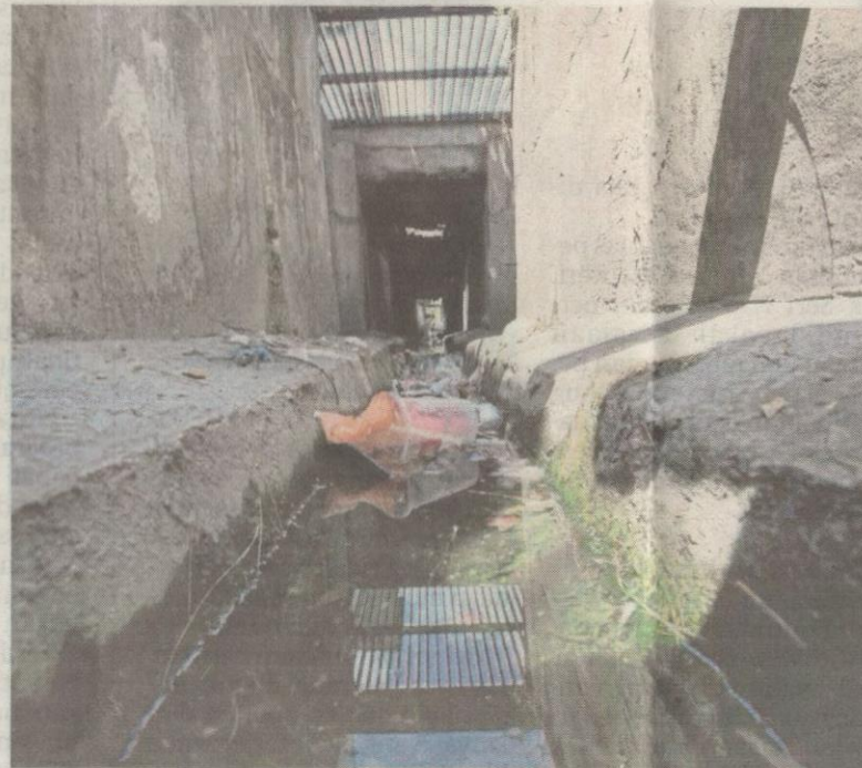
Tinjauan longkang bertakung yang menjadi punca nyamuk aedes membiak di Ampang.