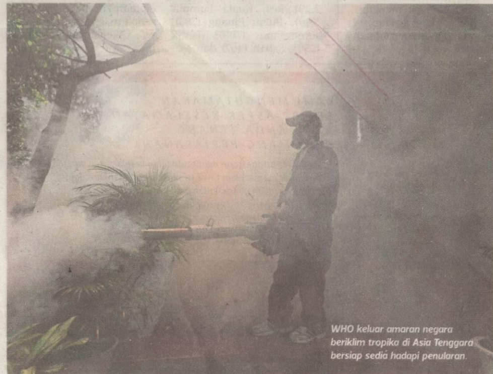
WHO keluar amaran negara beriklim tropika di Asia Tenggara bersiap sedia hadapi penularan.

Semalam, WHO turut berdebat jika wabak jangkitan virus Zika disyaki penyebab peningkatan kecacatan serius kelahiran di Amerika Selatan perlu dianggap safu kecemasan kesihatan global.