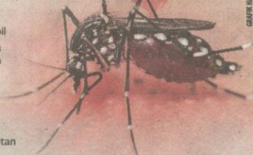
NYAMUK species Aedes aegypti