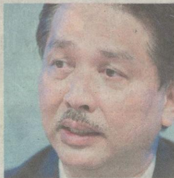
Noor Hisham Abdullah

Beliau berkata demikian ketika mengulas laporan BH yang mendedahkan strategi segelintir pengusaha perubatan alternatif memperdayakan ibu bapa dengan memperkenalkan vaksin homeopati palsu kononnya mampu