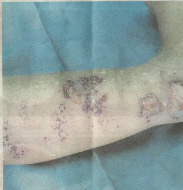
LUKA pada bahagian buku lali Syara.