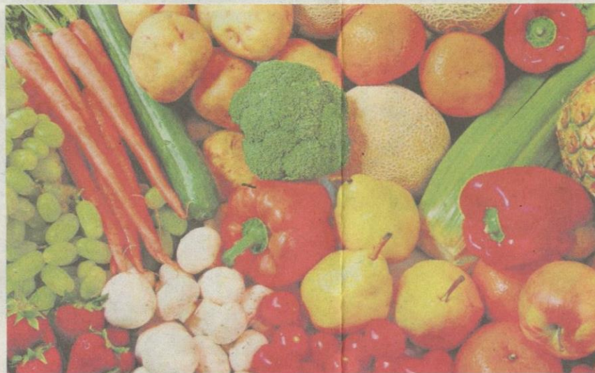
PEMAKANAN yang seimbang mampu mengurangkan penyakit migrain sekali gus membentuk gaya hidup lebih sihat.

doktor berbanding lelaki,” ujar Loder dalam nada sinis.