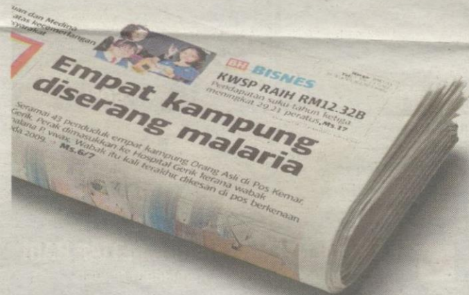
Keratan akhbar BH 22 November lalu.

“Sehubungan itu, semua penduduk sudah menjalani pemeriksaan dan diambil sampel darah mereka untuk pemeriksaan mikroskopi bagi mengesan jangkitan malaria, sama ada mereka mempunyai gejala jangkitan atau tidak,” katanya.