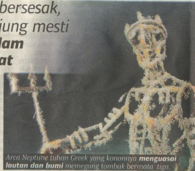
Arca Neptune tuhan Greek yang kononnya menguasai lautan dan bumi memegang tombak bermata tiga.

Muzium yang dinamakan Alley of Leaders ditubuhkan pada tahun 1992 di Cape Tarhankut di pesisir pantai Crimea, bekas wilayah Russia.