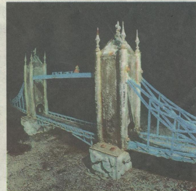
Replika Jambatan London turut menghiasi dasar laut di Cape Tarkhankut.