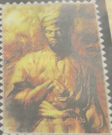
LARSAMANA TUN TUAH atau RIAI TUAH adalah HANG TUAH BIN HANG MAHMUD + DANG MERDUWATI (Ibuanya)

DAFTAR DIRI HANG TUAH HANG TUAH BIN HANG MAHMUD + DANG MERDUWATI (Ibuanya) DAFTAR DIRI HANG TUAH HANG TUAH BIN HANG MAHMUD + DANG MERDUWATI (Ibuanya)