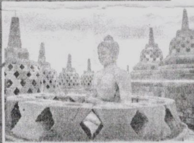
CANDI Borobudur di Indonesia dibina pada abad kesembilan.

Kompleks bersejarah berusia lebih 2,000 tahun itu jauh lebih tua berbanding Angkor Wat yang dibina pada abad ke-12 manakala candi Borobudur pada abad kesembilan.