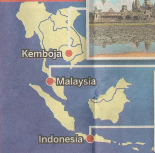
Peta lokasi tapak Sungai Batu, Borobudur dan Angkor Wat

Tapak Arkeologi Sungai Batu, Lembah Bujang itu disahkan oleh pakar berusia lebih 2,000 tahun, manakala candi Borobudur yang dibina pada abad ke-9 berusia sekitar 1,200 tahun dan Angkor Wat pada abad ke-12 berusia 900 tahun. Acara bersejarah itu di-