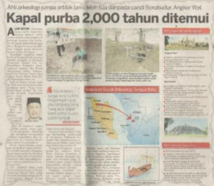
KERATAN Kosmo! 1 September 2015.

kar tamadun Mesir, tetapi tidak dapat dihubungi pada saat akhir. Sekiranya ada keperluan untuk kita ke Mesir dan dapatkan tandatangannya, kita akan ke sana,” kata Mokhtar kepada Bernama semalam.