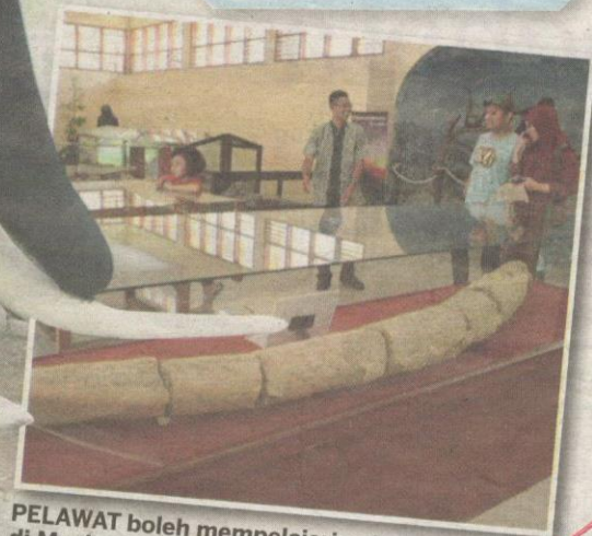
PELAWAT boleh mempelajari pelbagai sejarah di Muzium Trinil.

Untuk memberikan respons, sila e-mel ke kosmoantara@gmail.com