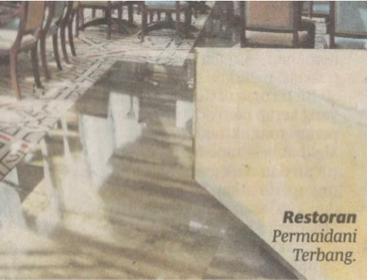
Restoran Permaidani Terbang.