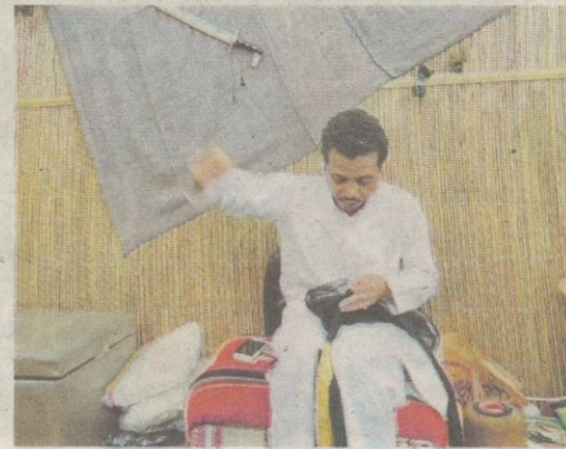
Tukang jahit jubah di Souq Waqif.

The Pearl Qatar adalah pulau buatan terletak di luar pantai Teluk Barat, menampilkan gaya hidup pelayar Mediterranean yang dilengkapi menara residensi, villa, hotel, pusat beli-belah dengan jenama mewah, selain restoran serta kafe di sepanjang dermaga.