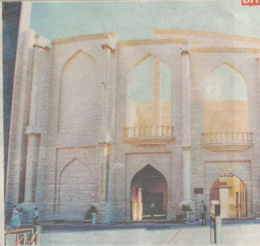
Masjid di Kampung Budaya Katara.