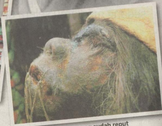
KEPALA manusia yang sudah reput menjadi antara bahan pameran di muzium tersebut.

suasana seram. Menurut seorang pengunjung dari San Francisco, Amerika