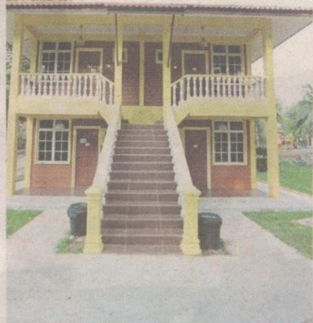
Penginapan selesa di Balau village resort.

Muzium Nelayan Tanjung Balau dibuka pada 1993 yang berkonsepkan kehidupan dalam perkampungan nelayan menjadi rujukan utama mendapatkan sumber maklumat, sejarah dan khazanah nelayan dalam negara.