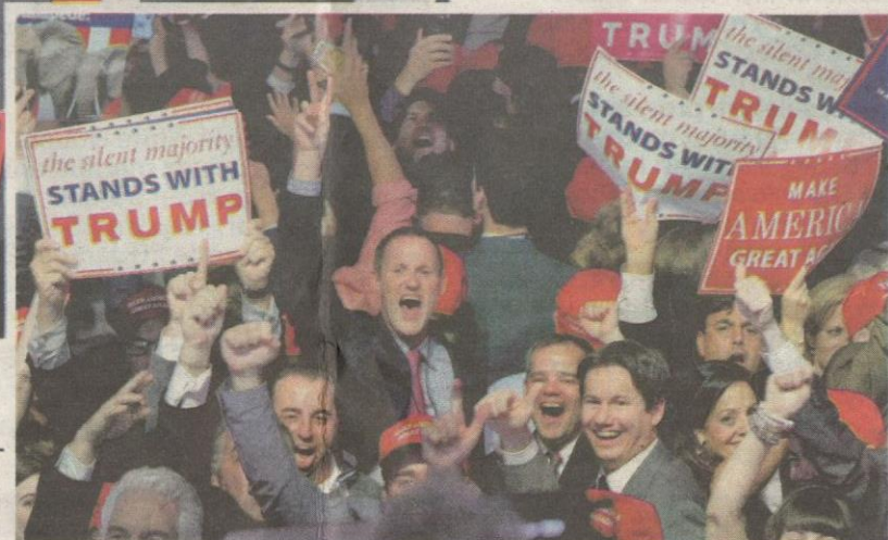
KANAN: Para penyokong Trump bersorak girang selepas bilionair itu diumumkan menang jawatan Presiden AS yang ke-45 di Manhattan, New York semalam.