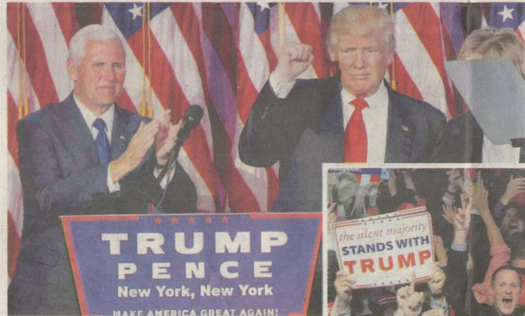
TRUMP meraikan kemenangannya bersama Naib Presiden, Mike Pence sewaktu bertemu dengan penyokong Parti Republikan di Manhattan, New York semalam.

“Tiada apa lagi yang perlu diperkatakan pada malam ini,” katanya.