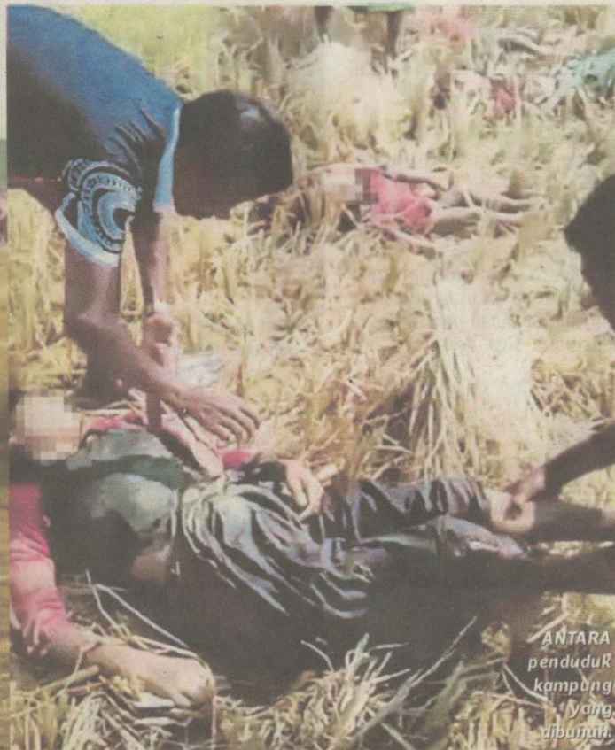
ANTARA penduduk kampung yang dibunuh.