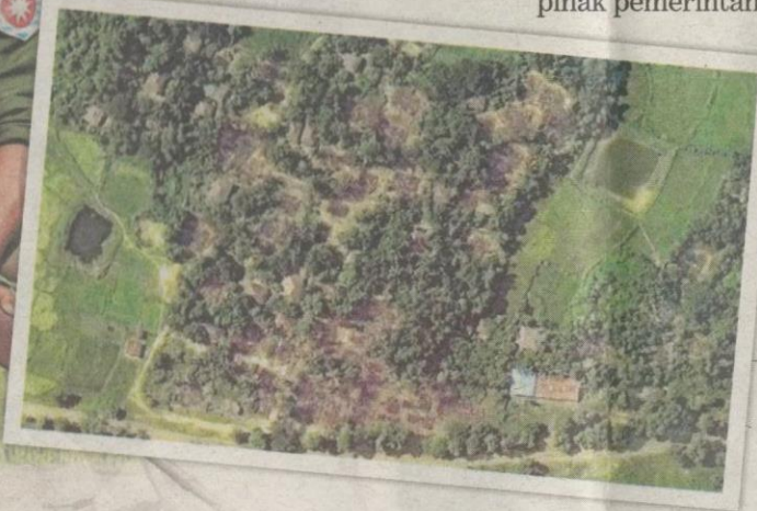
IMEJ satelit menunjukkan kampung Kyet Yoe Pyin di Rakhine yang musnah dibakar.