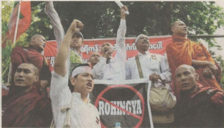
MASYARAKAT Buddha di Myanmar tidak mengiktiraf etnik Rohingya sebagai penduduk tempatan.

KANAK-KANAK Rohingya turut menjadi mangsa kekejaman yang berlaku di Rakhine.