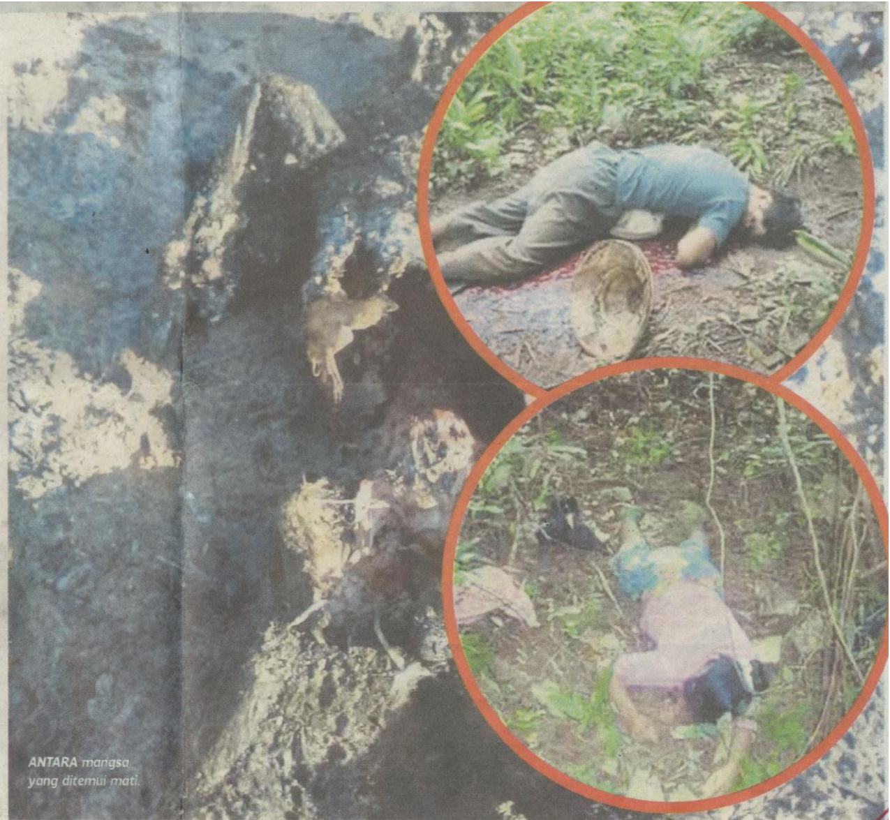
ANTARA mangsa yang ditemui mati.

FAKTA 300 wanita dikumpulkan di padang diarahkan supaya berbogel sebelum dirogol