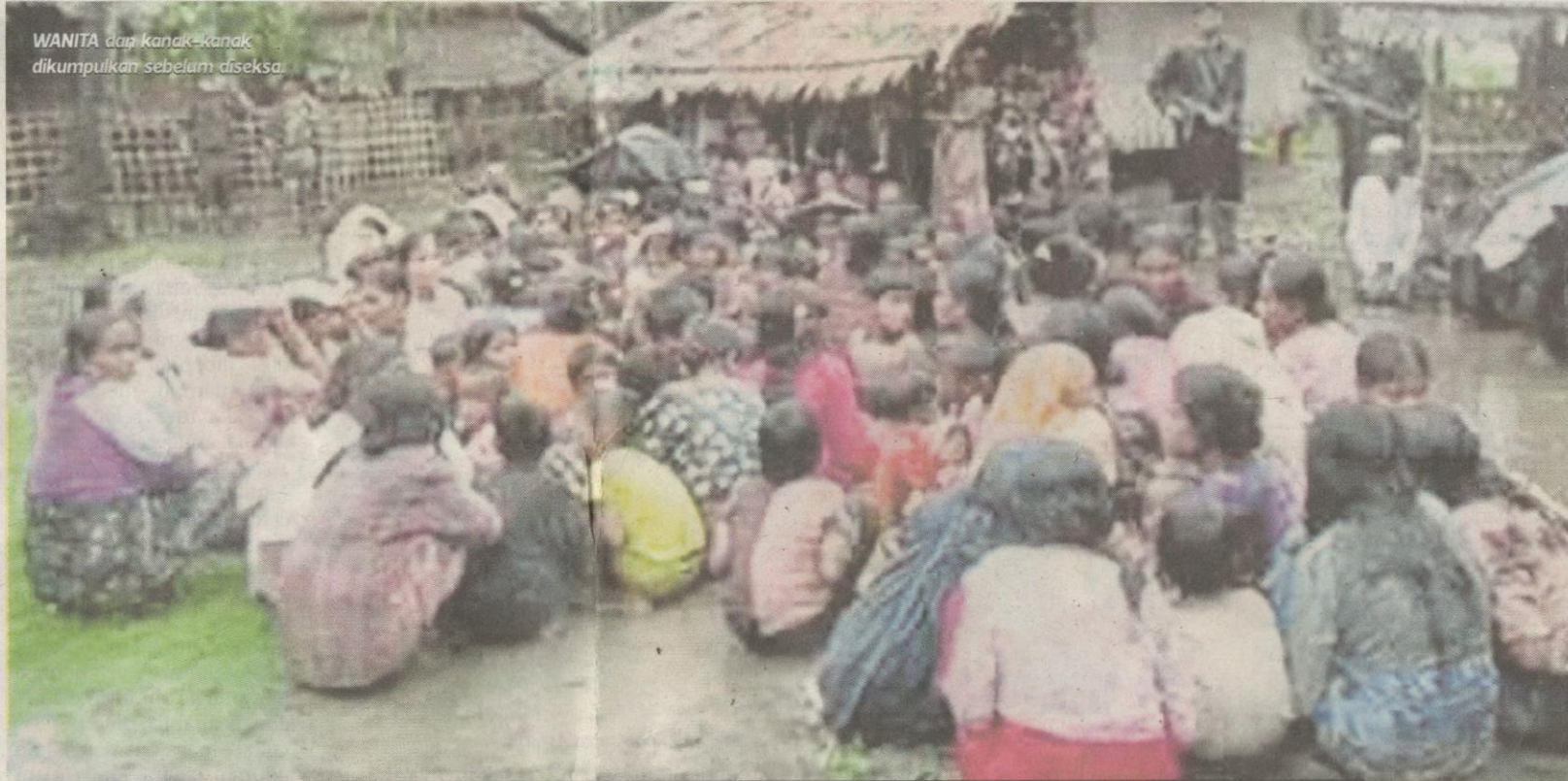
WANITA dan kanak-kanak dikumpulkan sebelum diseksa.