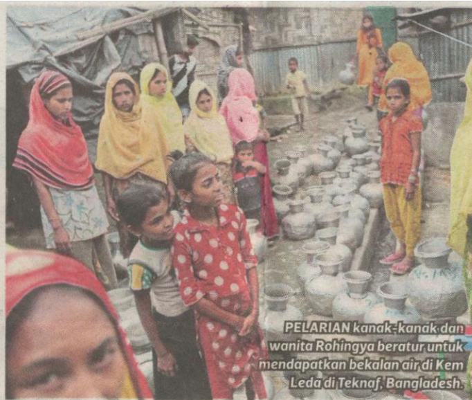
PELARIAN kanak-kanak dan wanita Rohingya beratur untuk mendapatkan bekalan air di Kem Leda di Teknaf, Bangladesh.