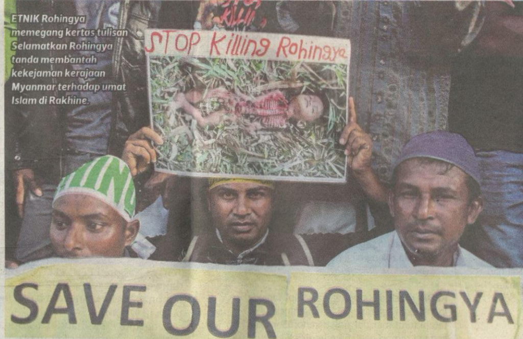
ETNIK Rohingya memegang kertas tulisan Selamatkan Rohingya tanda membantah kekejaman kerajaan Myanmar terhadap umat Islam di Rakhine.