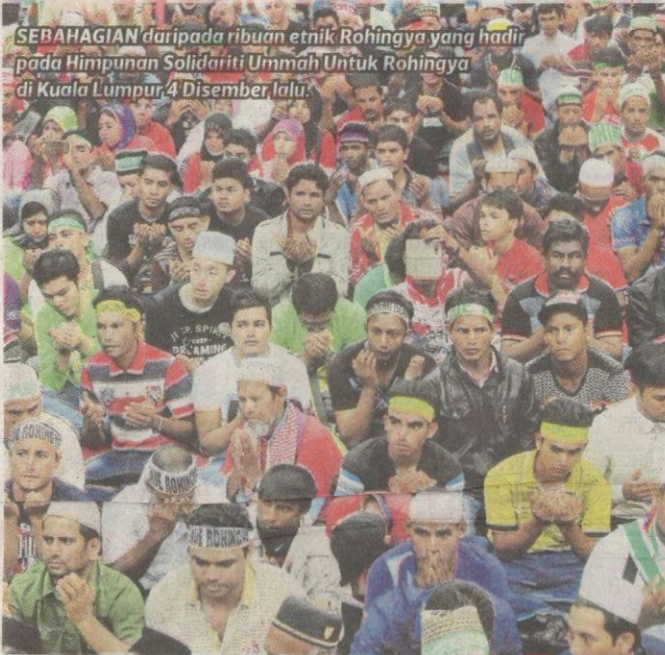
SEBAHAGIAN daripada ribuan etnik Rohingya yang hadir pada Himpunan Solidariti Ummah Untuk Rohingya di Kuala Lumpur 4 Disember lalu.

UNIT RUJUKAN DAN DOKUMENTASI DITERIMA 16 DEC 2016 U.R.D. M.P.P.