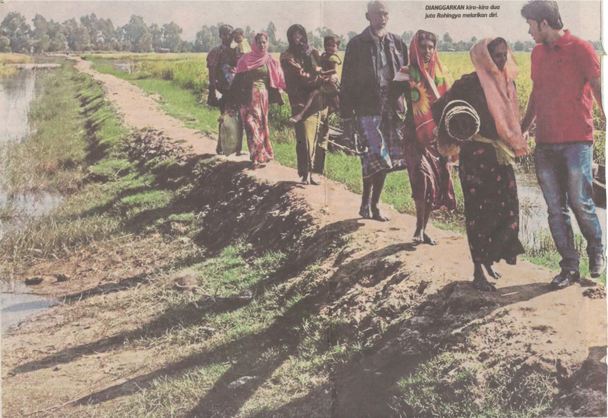
DIANGGARKAN kira-kira dua juta Rohingya melarikan diri.