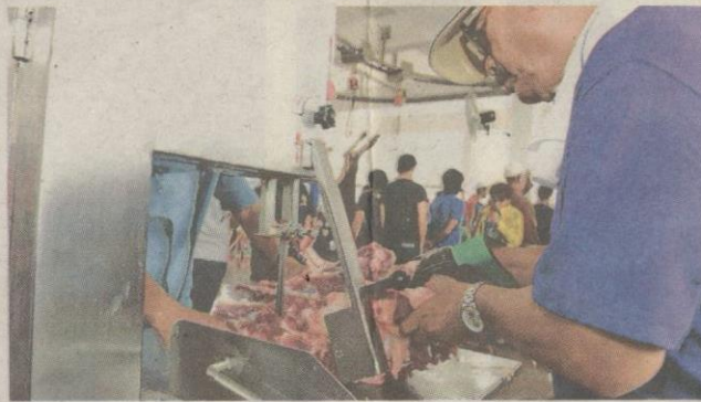
MEMOTONG tulang haiwan sembelihan lebih mudah dengan adanya mesin ini.