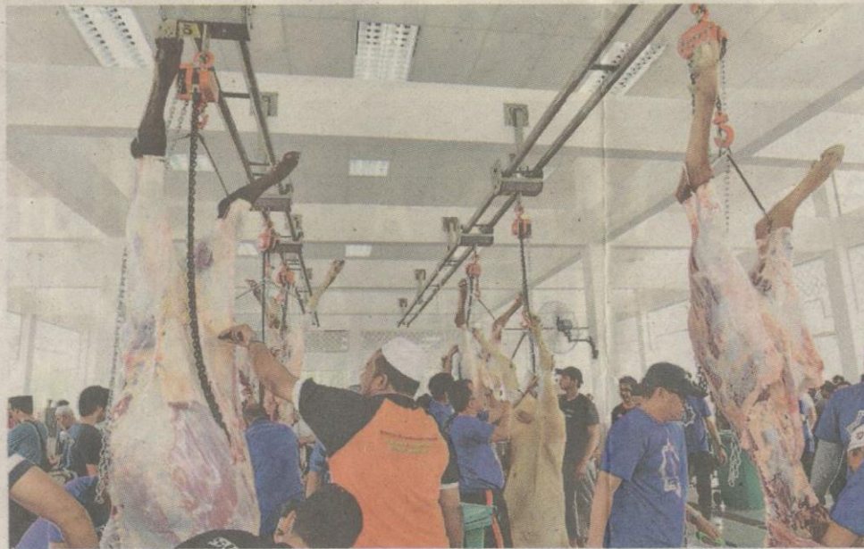
PROSES melapah dilakukan dengan mudah dan pantas selepas haiwan sembelihan digantung.