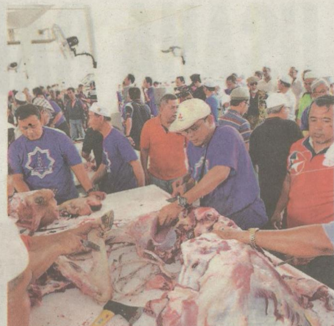
KESUNGGUHAN dalam mengerjakan ibadat korban menyatupadukan umat Islam.

han pula mungkin terdedah kepada kekotoran kerana kawasan melapah yang berseparah.