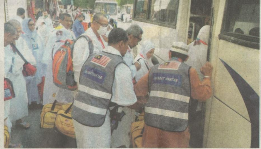
SEBAHAGIAN jemaah haji Malaysia menaiki bas untuk perjalanan ke Arafah baru-baru ini. – Gambar hiasan.

Sementara itu, jurucakap Wisma Putra ketika dihubungi berkata, pihaknya belum menerima sebarang