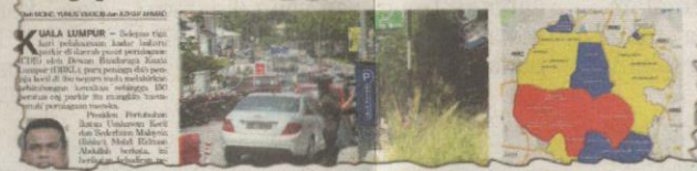
KERATAN Kosmo! 21 Julai 2016.

ding masing-masing pada kadar RM2 dan RM3 yang dikenakan pada 18 Julai lalu.