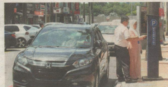
PENGUNA tidak lagi perlu membayar caj parkir yang tinggi apabila DBKL bertindak menurunkan kadar bayaran antara 20 hingga 30 peratus di Kuala Lumpur berkuat kuasa semalam. – Gambar hiasan