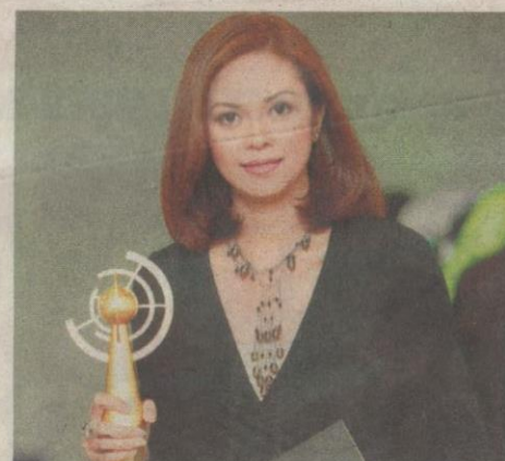
KEBIJAKSANAAN dan keperahan Tengku Permaisuri Norashikin sebagai pembaca berita membolehkan baginda diangkat sebagai Penyampai Berita Terbaik Anugerah Seri Angkasa tahun 2005.

Bagaimanapun, beliau menyatakan pihak istana tidak akan mengadakan sebarang istiadat pemsyukuran rasmi mengenai pelantikan Tengku Permaisuri