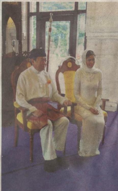
SULTAN SHARAFUDDIN melantik Norashikin sebagai Tengku Permaisuri Selangor dengan memakai gelaran Tengku Permaisuri Norashikin berkuat kuasa kelmari.

Keperahan, keyakinan dan kecantikan Tengku Permaisuri Norashikin sewaktu menyampaian berita akhirnya membolehkannya memenangi Anugerah Penyampai Berita Terbaik Anugerah Seri Angkasa 2005.